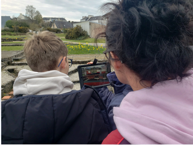
visite des vestiges en réalité augmentée et atelier de pratique archéologique