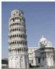
La Torre di Pisa